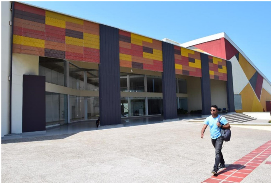
Centro Cultural- Universidad del Atlántico-Sede Norte