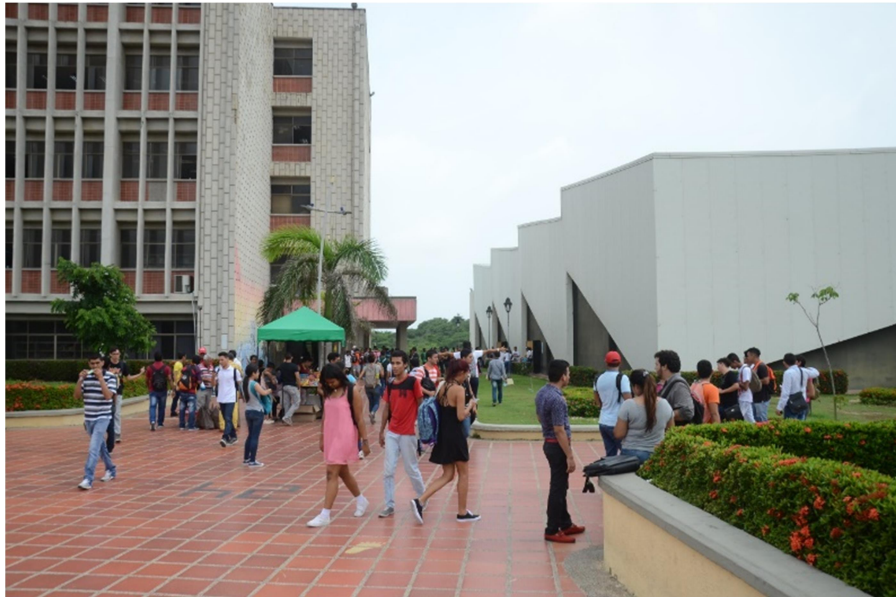
Biblioteca y Centro Cultural- Sede Norte