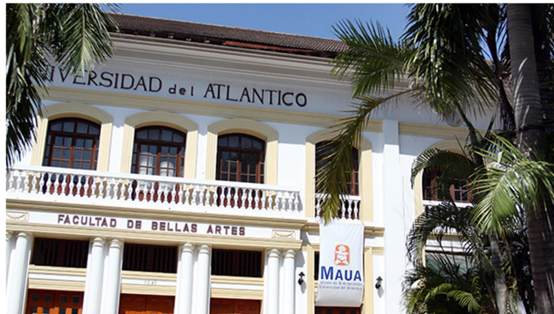
Facultad de Bellas Artes en el emblemático Barrio el Prado de Barranquilla