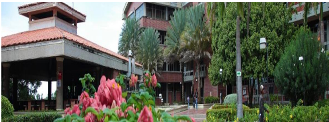
Sede Norte-Puerto Colombia