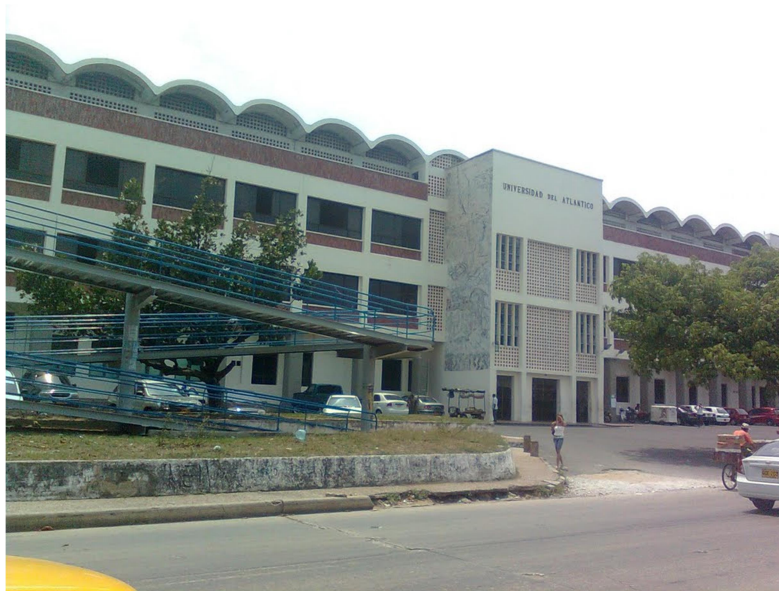
Sede Centro. Carrera 43 (Avenida 20 de Julio)-Barranquilla