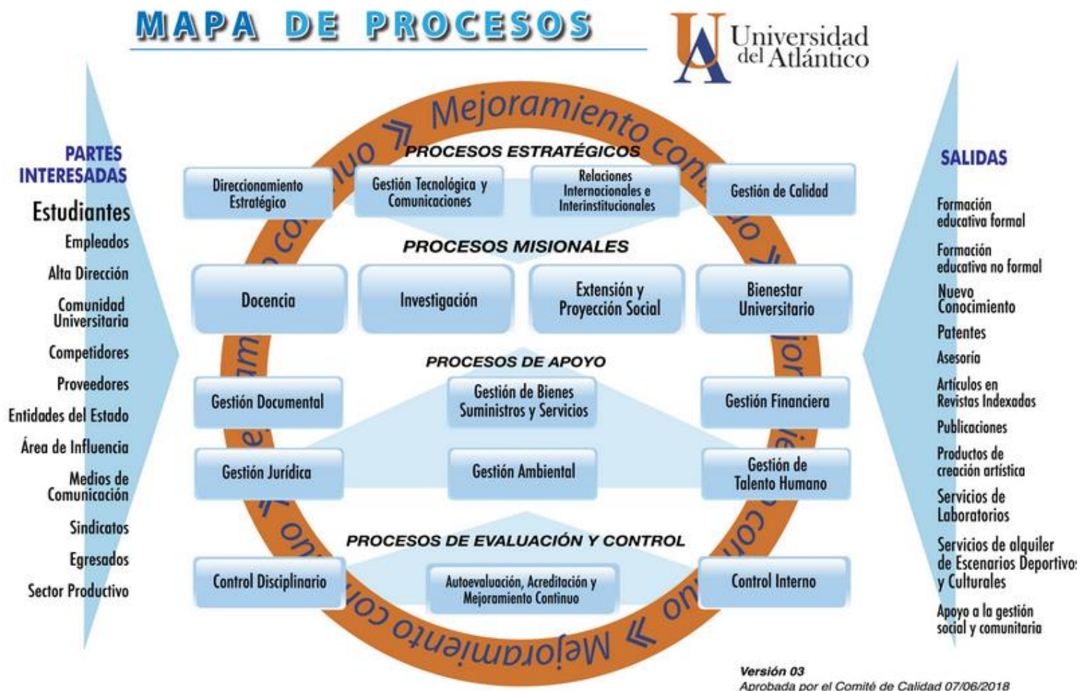
Figura 2. Mapa de Proceso