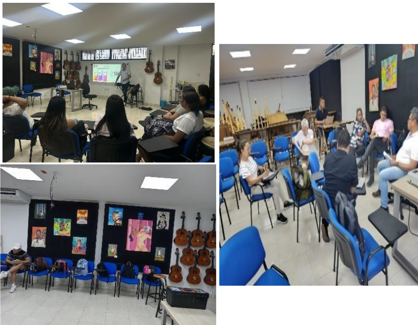
Figura 2. Laboratorio Lucia Vélez, programa licenciatura en educación artística.