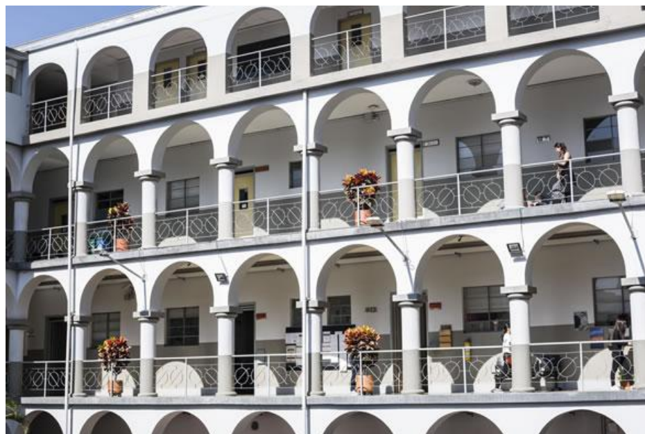
Figura 5. Sede Universidad San Buenaventura, Seccional Medellín.