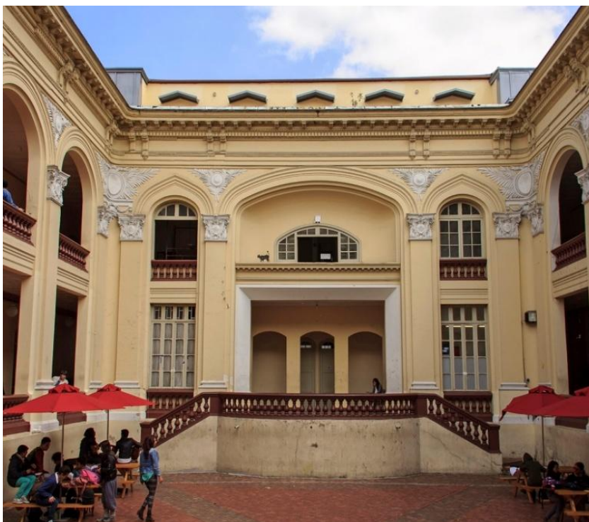
Figura 3. Sede Universidad Francisco José de Caldas.