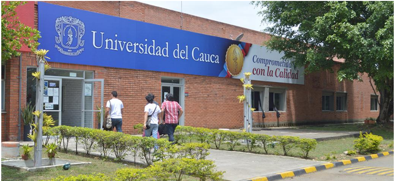
Figura 6. Sede Universidad del Cauca.