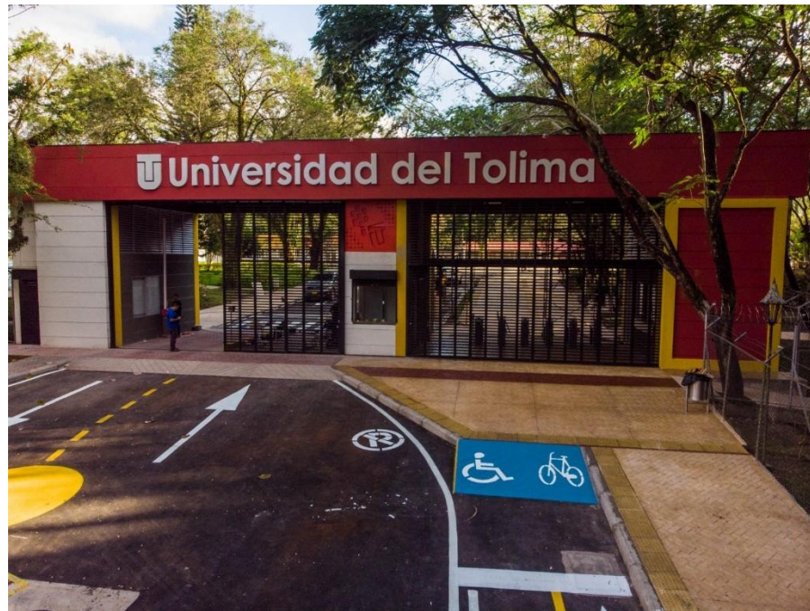
Figura 4. Sede Universidad del Tolima